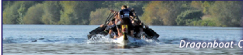
Dragonboat-Club Borken e.V.