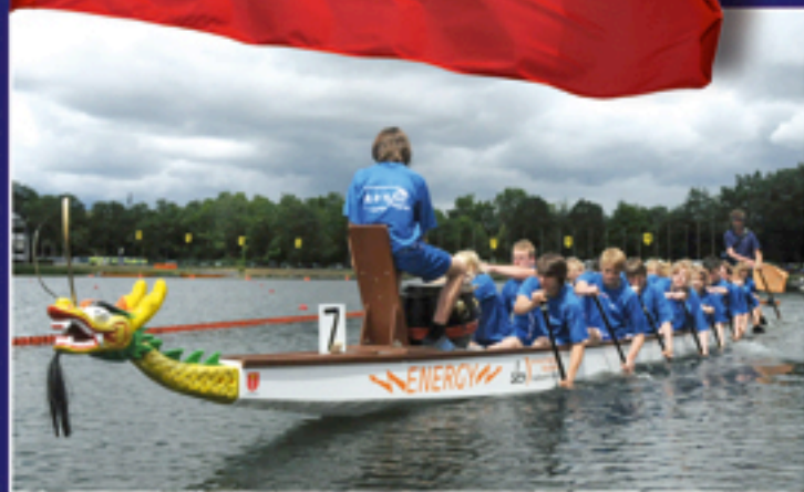
Young Blue Dragons

3 x 1. Platz NRW Landesmeister 4 x 2. Platz NRW Vize-Landesmeister 3 x 3. Platz