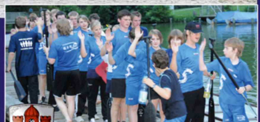
Blue & Young Blue Dragons aus Borken