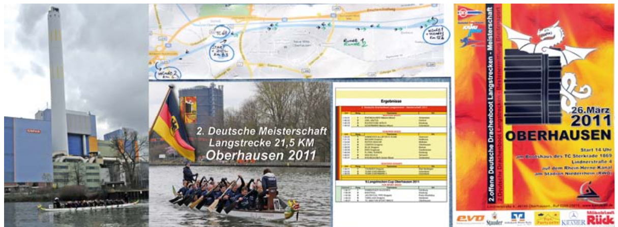
in Oberhausen Langstrecke über 21,5 Kilometer