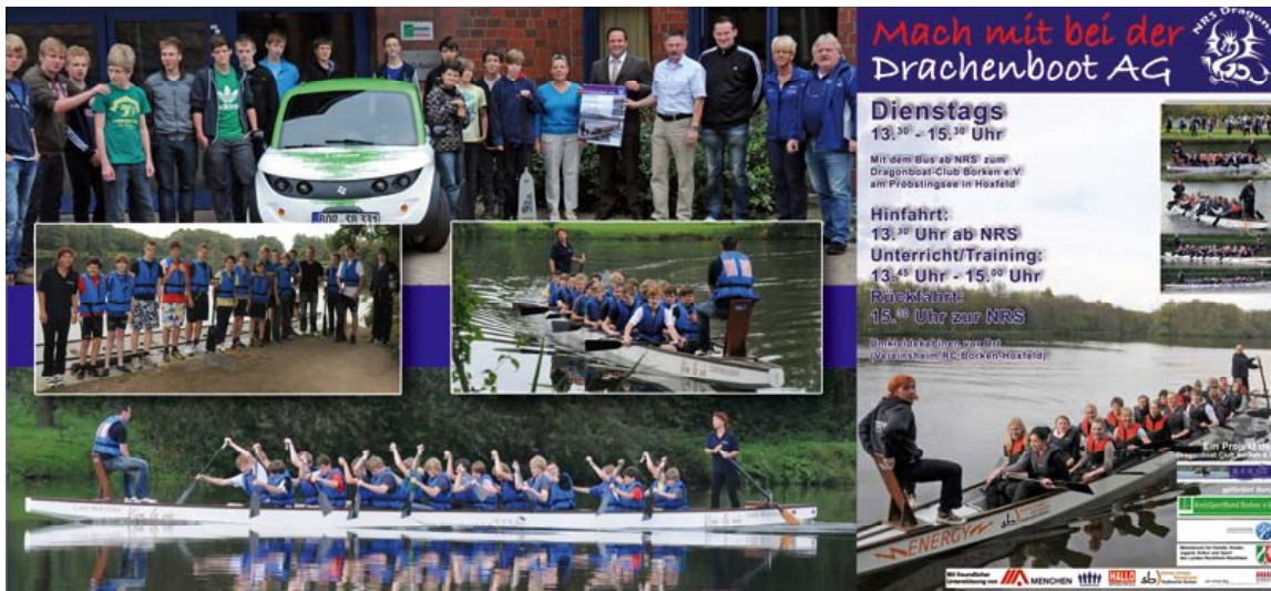
Drachenboot AG Nünning Realschule