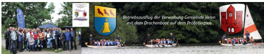
Gemeinde Velen zu Gast im Dragonboat-Club