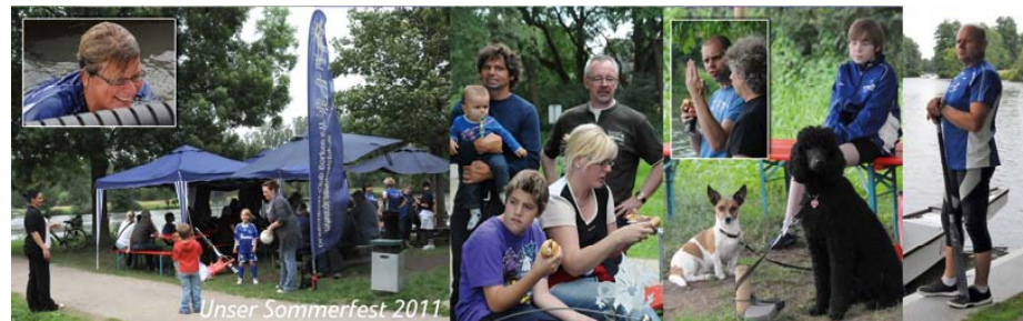
Sommerfest 2011 ... manche gehen baden