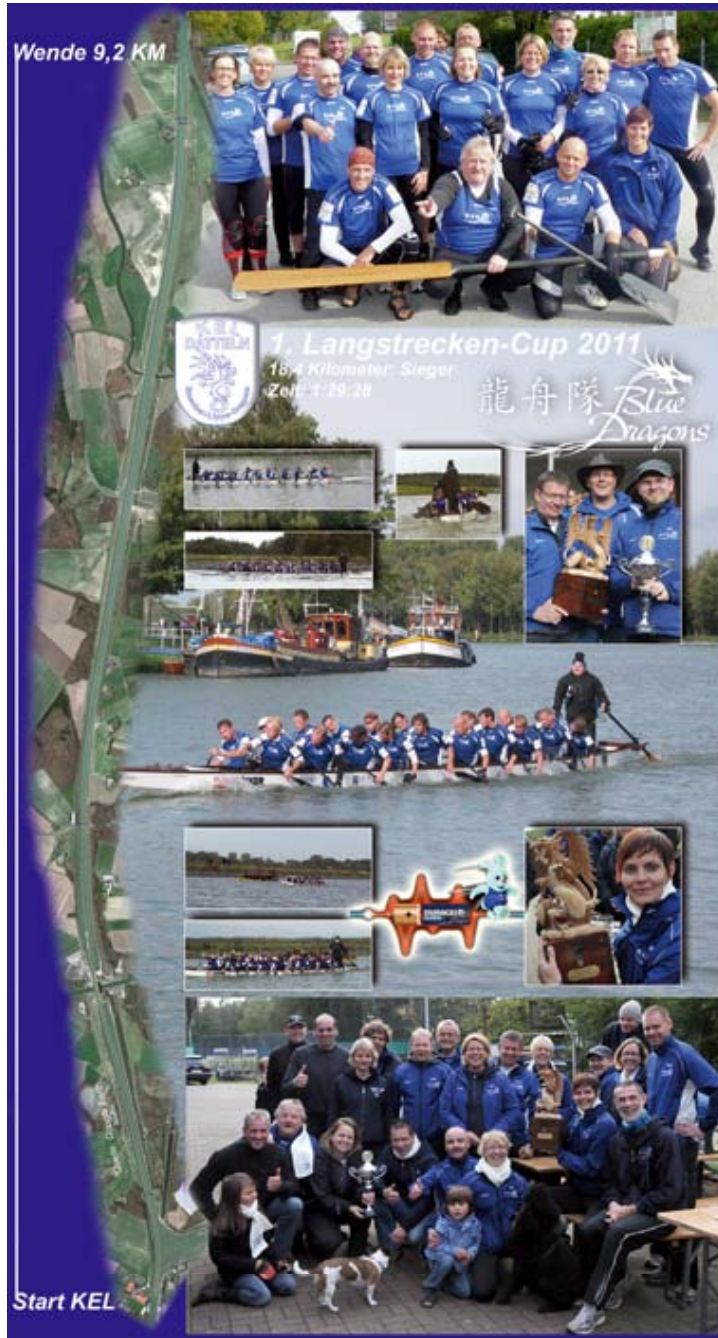
Langstrecke Datteln Blue Dragons 18,4 Kilometer 1:29:28