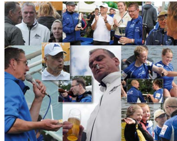
- Kanalfest in Duisburg Meiderich beim 1. MKC