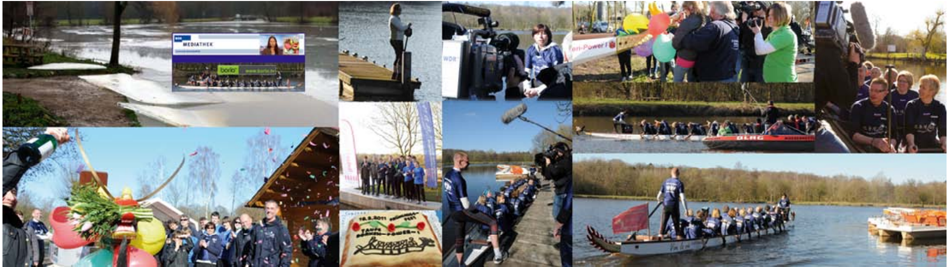
Frühlingsfest Bootstaufe, WDR Lokalzeit 790.000 TV-Guckern, Borio-TV und vielen Gästen am Pröbstingsee.