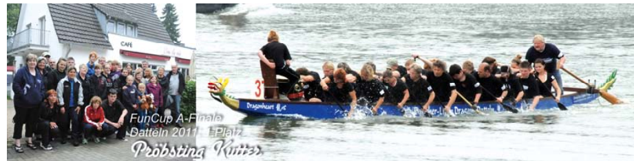
Der Pröbsting-Kutter zeigt die ganze Bauern-Power in Datteln