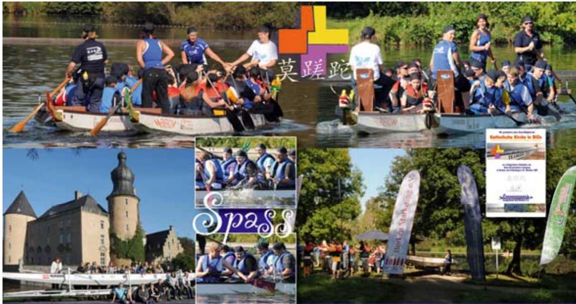
BiOs Kirchengemeinde zu Gast