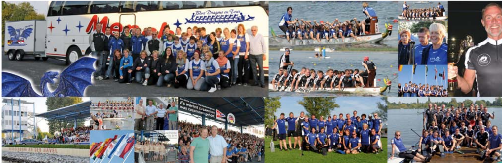
- Deutsche Meisterschaft in Brandenburg