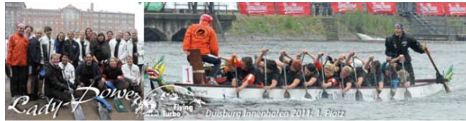
Frauen Power dominiert in Duisburg, Innenhafen: 1. Platz