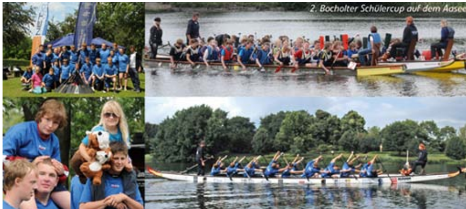
Die Young Blues beim 2. Schülercup in Bocholt auf dem Aasee